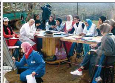
Un grup de dones algerianes participen en un projecte de l'ONG Centre d'Estudis Rurals i Agricultura Internacional ■ CERAI