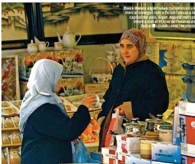
Dues dones algerianes compren en un mercat conegut com a Dubai i situat a la capital del país, Alger. Aquest mercat intenta imitar el luxe de l'emirat de Dubai

de Palau de Girona acull l'exposició 50 anys de Mans Unides, una mostra que repassa el mig segle de vida de l'ONG. C/ Saragossa, 27.