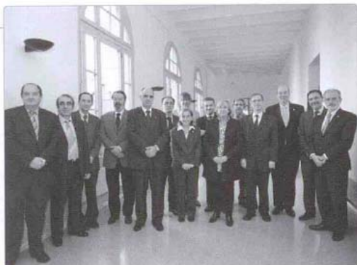
Inauguració del curs 2010-2011, presa de possessió del rector de la UJI