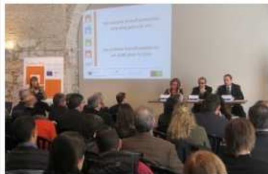
El públic de banda i banda de l'Albera reunit ahir per les universitats al castell de Sant Ferran de Figueres.