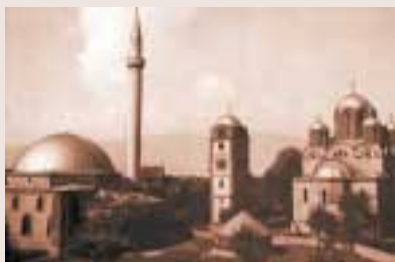
Una mesquita i una església ortodoxa conviuen a la ciutat kosovar d'Urosevac

Al cor dels Balcans trobem la regió de Kosova (nom albanès del territori que en serbocroat es coneix com a Kosovo), que limita al sud amb Albània, a l'est amb Macedònia, a l'oest amb Montenegro, i al nord amb la república de Sèrbia. Kosova té una extensió de prop d'11.000 quilòmetres quadrats i al seu territori viuen més de dos milions de persones. Kosova, igual que el conjunt dels Balcans, té una geografia diversa que combina les planes, com les de la regió de la Drenica, amb les zones muntanyoses frontereres amb Albània i Macedònia, entre altres.