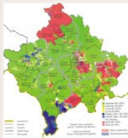
Composició ètnica de Kosova el 2000 segons dades de la KFOR i l'ACNUR

Kosova, situada en la frontera històrica entre l'Orient i l'Occident, ha cultivat al llarg dels segles una geografia humana diversa. Al seu territori han conviscut, i hi conviuen, diferents pràctiques religioses que han convertit el territori en una cruïlla cultural que permet apreciar, en els carrers d'alguns dels seus pobles i ciutats, la coexistència de mesquites i esglésies catòliques i ortodoxes, en una mostra més que evident de la geografia humana de la regió.