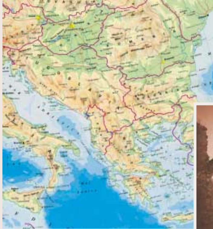
L'espai geogràfic balcànic segons la divisió estatal anterior a les guerres de Iugoslàvia