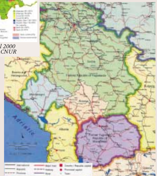
Kosova, la nova Unió de Sèrbia i Montenegro (antiga República Federal de Iugoslàvia) i els països veïns

De població majoritàriament musulmana, Kosova compta, però, amb altres creences religioses de destacat arrelament entre la seva població: la catòlica i l'ortodoxa. Aquesta diversitat religiosa es reflecteix també en la composició ètnica. De majoria albanesa, Kosova compta amb la presència de serbis -la minoria més important de la regió-, de bosnis, de turcs i de gitanos, entre altres. I és precisament aquesta geografia humana tan diversa, la que es troba en l'origen de les turbulències polítiques que han agitat el territori al llarg de bona part de la seva història.