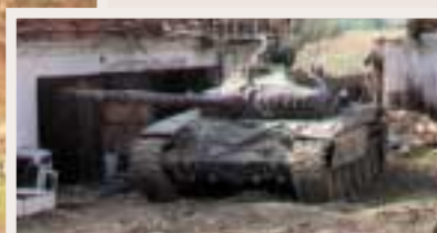
Un tanc iugoslau en plena acció a Kosova