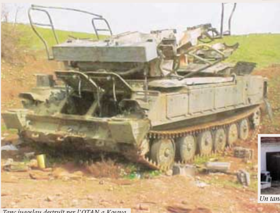
Tanc iugoslau destruït per l'OTAN a Kosova