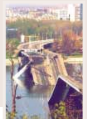
Pont de Novi Sad, a Sèrbia, destruït pels bombardejos de l'OTAN

A més de l'acord militar, les Nacions Unides adoptaren la resolució 1244 que recolzava els acords assolits a Kumanovo i que establia que Kosova havia de veure restituïda la seva autonomia en el marc de Iugoslàvia i que, després de la retirada de l'exèrcit i l'entrada de les tropes de l'OTAN, les Nacions Unides assumirien interinament l'administració del territori per tal d'assentar les bases del seu desenvolupament.