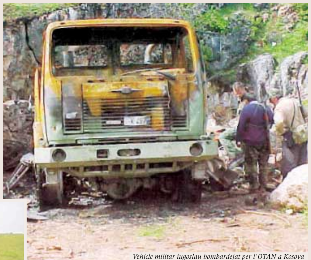
Vehicle militar iugoslau bombardejat per l'OTAN a Kosova