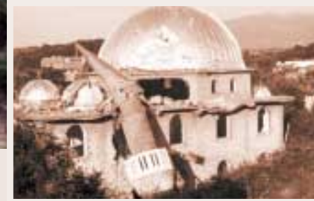
Mesquita destruïda durant el conflicte bèl·lic