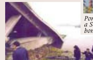
Pont de la via fèrrea destruït també per l'OTAN a Novi Sad