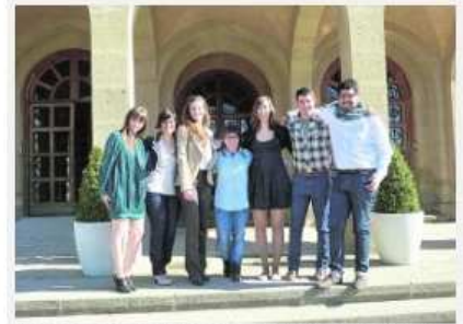
Los componentes del equipo de debate de la UA.