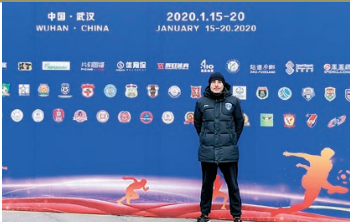
Aumatell va tornar a Wuhan després de les vacances de Nadal

L'osonenc és, juntament amb un altre company, l'últim dels entrenadors catalans que quedaven a Wuhan. La resta van marxar de