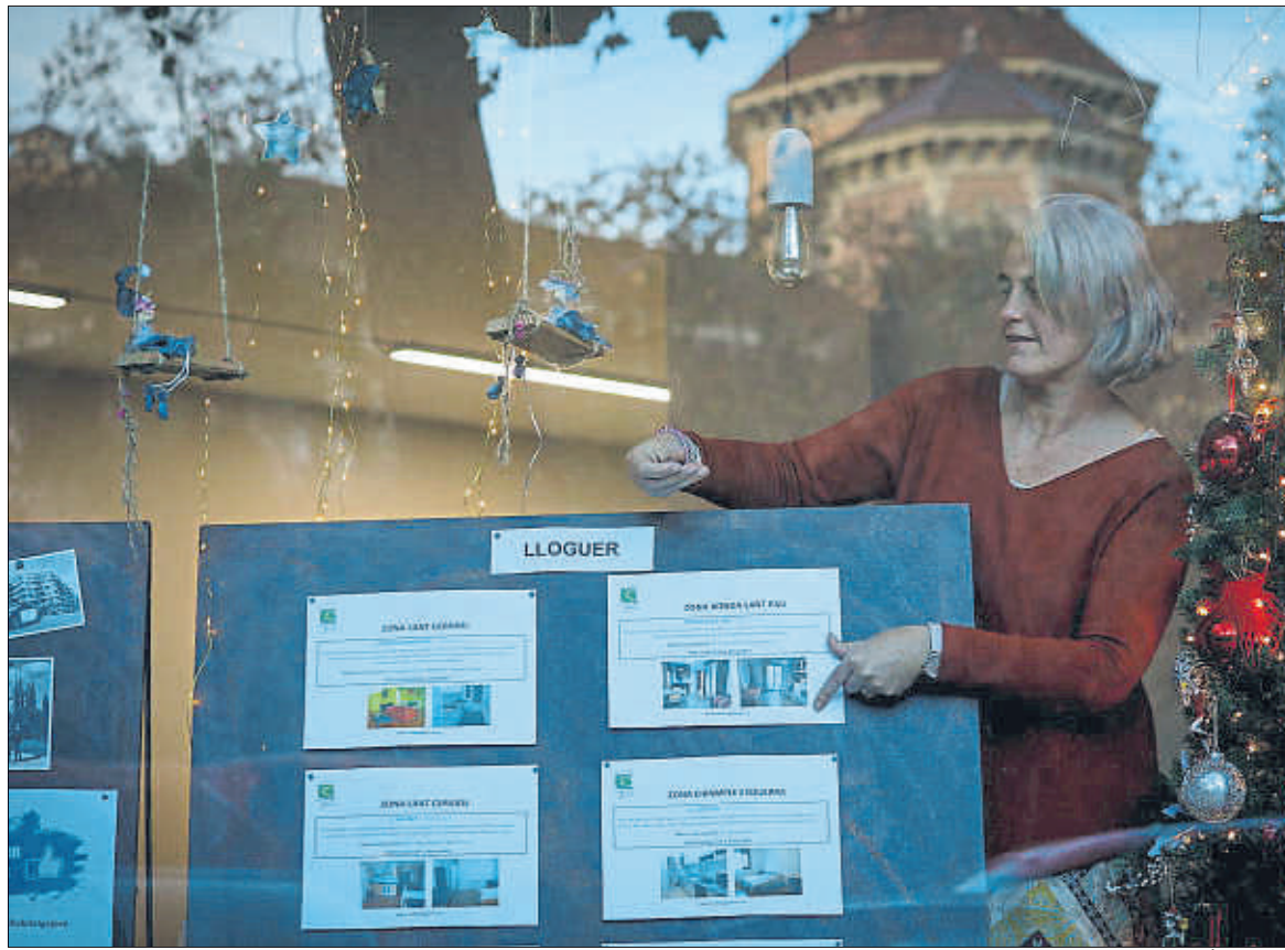
La taxa d'emancipació juvenil torna a descendir pels baixos salaris i la falta d'accés a l'habitatge

Així ho posa de manifest l'Observatori d'Emancipació corres-