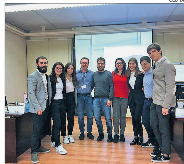
Imatge de l'equip guanyador de la competició de debat.