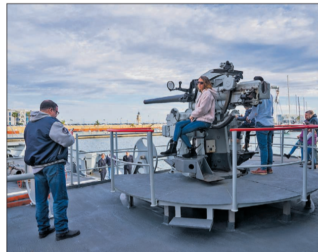
Imatge d'alguns visitants durant el recorregut pel vaixell.