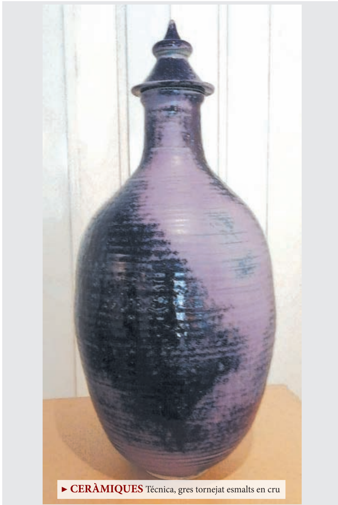
► CERÀMIQUES Técnica, gres tornejat esmalts en cru